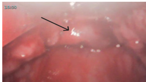
Gambar 2. Epiglotis dan Jaringan Sekitar Tampak Edema dan Hiperemis

Premedikasi dengan metoclopramid 10 mg i.v dan ranitidin 50 mg i.v. Hemodinamik sebelum induksi: TD 184/100 mmHg, nadi 111 x/menit, SpO 2 98%. Bersamaan dengan tim obstetri melakukan desinfeksi lapangan operasi, preoksigenasi dilakukan selama 5 menit dengan simple mask 10 lpm, SpO 2 mencapai 99%, kemudian dilanjutkan dengan nasal kanul 5 lpm pada periode apnea. Induksi dilakukan dengan teknik modified rapid sequence induction (RSI) menggunakan fentanyl 100 mcg, propofol 100 mg, dan rocuronium 50 mg, dengan tekanan krikoid. Hemodinamik pasca induksi: TD 140/79 mmHg, nadi 100 x/menit, SpO 2 97%. laringoskopi menggunakan video laringoskop didapatkan Cormack-Lehane grade III dengan epiglotis dan jaringan sekitarnya tampak edema dan hiperemis.