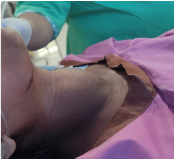
Gambar 1. Foto Klinis pada Pasien dengan Pembesaran pada Kelenjar Tiroid